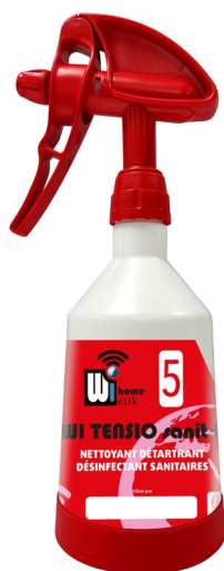
Pulvérisateur 500 ml - WR003A